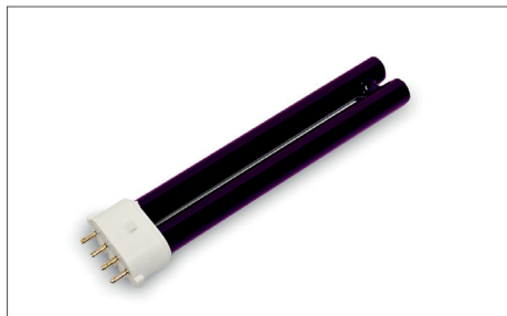
Safescan UV 50 / 70 Lampade UV