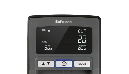
Mostra quantità e totali