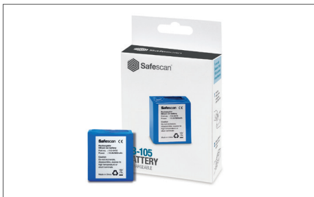
Safescan LB-105 Batteria ricaricabile Art. no: 112-0410