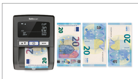
Inserimento di banconote in euro in qualsiasi direzione