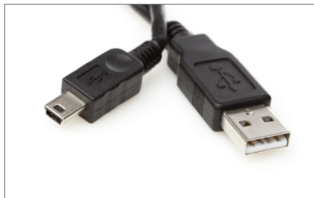
Safescan USB cable de actualización Art. no: 112-0459